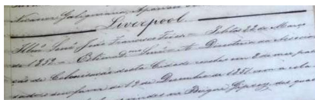
Bibliotheca Pública Pelotense: Atos da Colônia 16 abril 1850 - 4 julho 1853, 150 p. BIC 001e