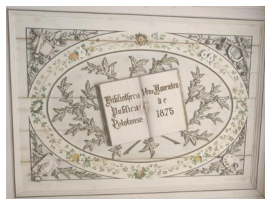
Bibliotheca Pública Pelotense, Pelotas, Rio Grande do Sul, Brasil. Fundado em 1875.

PELOTAS. Diário de Registro dos Mantimentos Fornecidos aos Colonos da Colônia D. Pedro II. Museu da Biblioteca Pública Pelotense, v. 27-b, 1852.